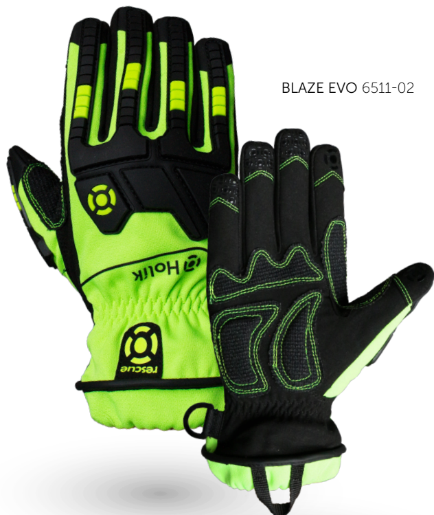
BLAZE EVO 6511-02