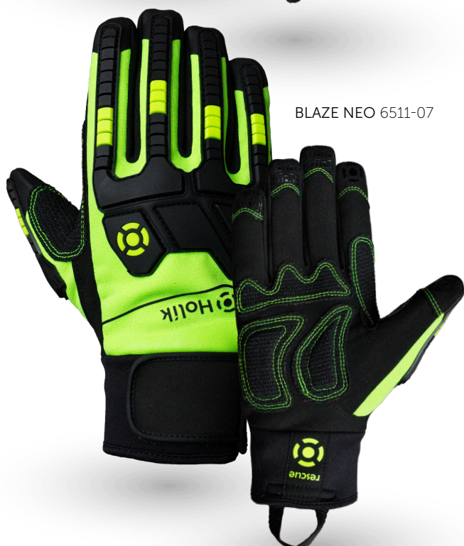
BLAZE NEO 6511-07