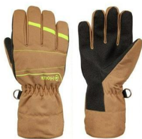
Brella Easy Beige