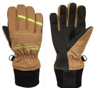
Brella Flexi Beige