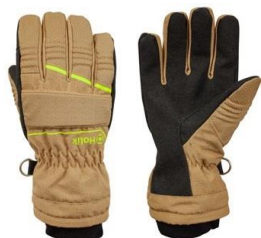
Crystal Evo Beige