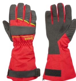
Crystal Long Red