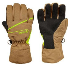
Maris Easy Beige