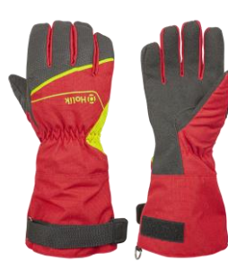
Maris Long Red