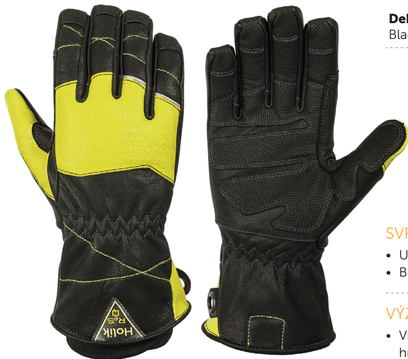
Deborah I 8268 Black / bitter lemon

Jedinečný model pro užití vysoce visibilní kůže. Kontrukce rukavice prošla dlouhým vývojem a přináší vysokou citlivost a příjemnou manipulaci s předměty.